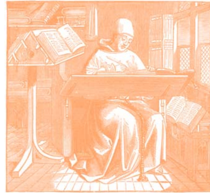
SCRIPTORIUM MONK AT WORK.